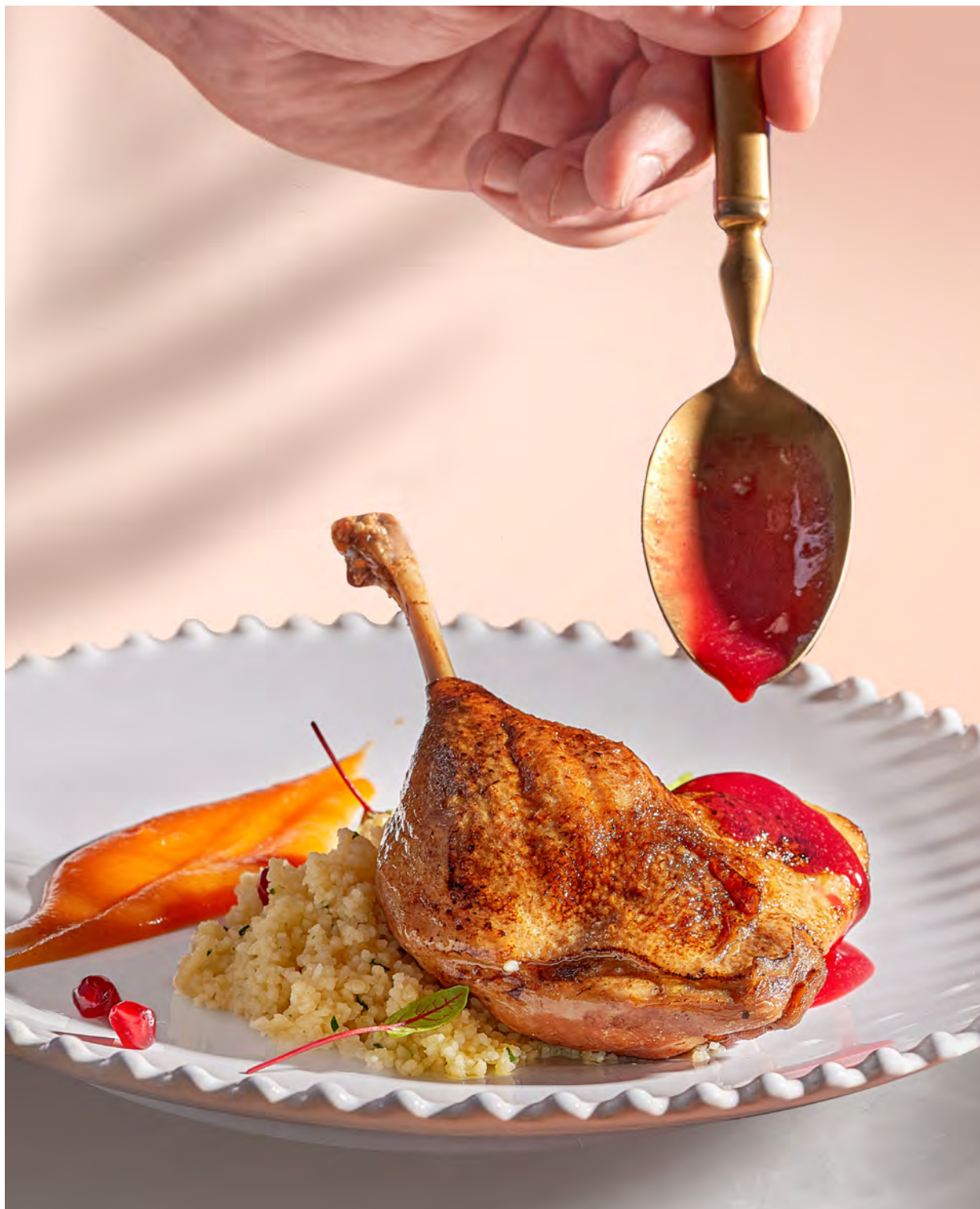
УТИНАЯ НОЖКА КОНФИ С КУСКУСОМ И ТЫКВЕННЫМ ЧАТНИ