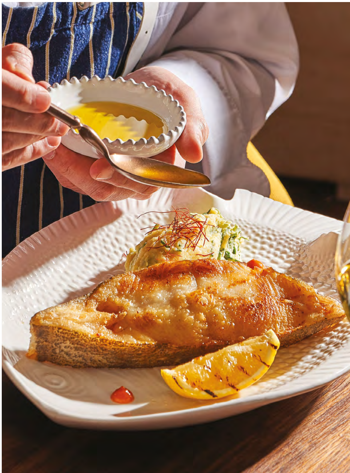
БОЛЬШОЙ СТЕЙК ИЗ ПАЛТУСА с пюре из картофеля и шпината